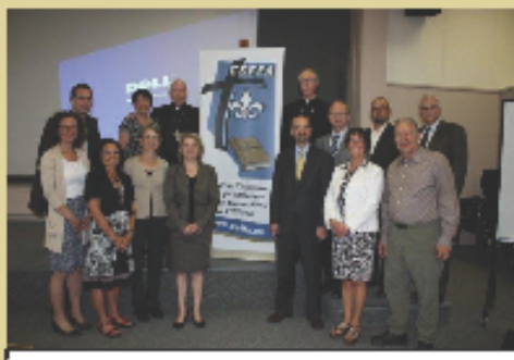
Le CA du CÉFFA et ses partenaires